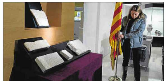
Els blocs, exposats ahir al Museu Arqueològic de Catalunya

LA CLAU DEL CAS. Hor, Horus, és el déu representat pel falcó, i es col·loca davant, al jeroglífic, en senyal de respecte, ja que és una deïtat. El nom complet és Imep-Hor