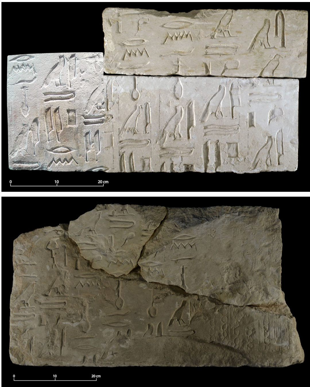
Fig. 6. (a) Grupo de tres fragmentos de caliza documentados en el mercado de antigüedades que casan entre sí y formaban la mayor parte de la superficie inscrita de un bloque, con texto dispuesto en columnas. (b) Bloque KKh01/02A&B+KKh21/30, con parte de relieve de estela de falsa puerta (a la derecha) y 6 columnas de texto (a la izquierda).

El tercero de los bloques, el más importante (en tres fragmentos: KKh01/02A&B+KKh21/30) (Fig. 6b), presenta, en su tercio derecho, un motivo iconográfico. Se trata de una estela de falsa puerta grabada muy ligeramete, de la que se aprecia bien el entramado de líneas verticales, columnas de círculos, trazos horizontales y líneas en zigzag que caracteriza este motivo cuando está pintado o grabado. Es un motivo frecuente en las cámaras funerarias de tumbas de la VI dinastía y suele situarse en la parte central de la pared en que se encuentra (Jéquier, 1929: láms.