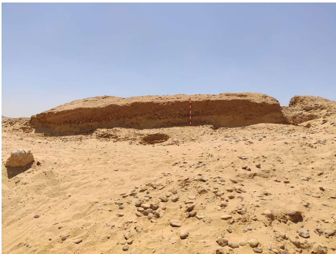
Fig. 1. El relleno de mastaba, formado por gravas, arena, piedras y cascotes.

menos que la parte este del relleno compacto, formado de gravas, arena, piedras y cascotes, de un edificio macizo de planta cuadrangular, o sea, una mastaba (Fig. 1). El lado este de este relleno se conservaba prácticamente íntegro y medía 10,30 m de norte a sur por 1 m de altura de media. De los lados norte y sur se conservaba tan sólo el extremo este. De la parte oeste del relleno no se conservaba nada, porque había estado en lo que ahora era la zanja de los saqueadores. No sabemos, por tanto, qué dimensiones debió tener el monumento completo, 6 pero lo conservado es sin duda tan sólo un tercio o un cuarto del mismo. Esto significa que el pozo y la cámara funeraria subterráneos estuvieron en lo que hoy es la zanja. Es evidente que ésta fue la razón por la que los saqueadores desventraron el kom por esta parte. Debieron encontrar la cámara y decidieron hacer lo que ya sabemos: llegar hasta ella por medio de excavadoras y, a continuación, llevársela por delante a base de paladas y depositar los bloques en la zona norte del montículo. Allí seleccionarían los más adecuados para ser introducidos en el mercado ilegal de antigüedades y empezarían a cortarlos y prepararlos por medio de sierras radiales.