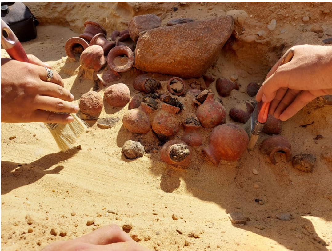
Fig. 2. Excavando el depósito de fundación del relleno de mastaba.

el revestimiento de caliza del muro este debió haber uno o dos nichos para el culto funerario. La inexistencia de capilla en la superestructura de la tumba implica que todos los bloques constructivos decorados con inscripciones y relieves estuvieron originalmente en la subestructura, o sea, formaron parte del revestimiento de los muros de la cámara funeraria. Esto es acorde con la evolución de las tumbas privadas durante la VI dinastía. Si precedentemente la decoración se concentraba en las capillas y cámaras de la superestructura y la subestructura no recibía decoración alguna, desde Unis y conforme avanza la VI dinastía la subestructura pasa a ser decorada, mientras que la superestructura lo es cada vez menos hasta llegarse a la situación inversa. El fenómeno es paralelo al que experimentan las tumbas reales con los Textos de las Pirámides (Dawood, 2005; Kanawati, 2010: 43-55; Russo, 2010: 262; Hays, 2015: 219).