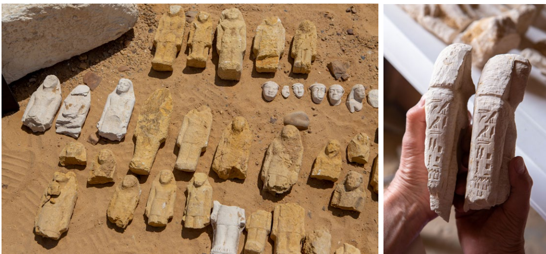
Fig. 7. (a) Estatuillas funerarias de Imephor Impy Nikauptah, completas o fragmentarias; (b) todas ellas llevan sistemáticamente inscritos sus tres nombres en el brazo derecho.

Se trata de piezas macizas, sin espacios negativos. El personaje aparece de pie, con las piernas juntas y los brazos hacia abajo, pegados al cuerpo (Fig. 7a). Las manos están cerradas en puño, con los pulgares extendidos hacia abajo, y sujetan el pañuelo símbolo de estatus (Fischer, 1975). La peluca es siempre larga, con los lados apoyados sobre los hombros. Los rostros son muy diversos, a veces muy expresivos, a veces más estereotipados. Los ojos tienen formas muy variadas: rasgados, proporcionados o muy grandes; suelen estar esculpidos con detalle y reproducen la ceja y el párpado. La nariz y la boca son normalmente planas y los labios gruesos. El pecho y el vientre son casi siempre lisos, aunque a veces se marcan los pectorales, la línea vertical abdominal y el ombligo. La forma de la falda es muy variada: de muy larga a muy corta; la cintura puede estar marcada o no y, cuando lo está, puede ser una línea horizontal recta o curva. Las piernas están siempre juntas, con la separación central bien marcada, y son a veces proporcionadas y a veces muy cortas. Los pies también están siempre juntos y los dedos están bien marcados por cuatro incisiones paralelas. La figura humana puede estar o no apoyada en un pilar dorsal, pero, salvo en un caso, en el que la parte posterior del cuerpo está esculpida, la parte posterior de las estatuillas consiste en una superficie plana o ligeramente convexa, con los lados rectos o bien más anchos en los brazos y más estrechos en las piernas.